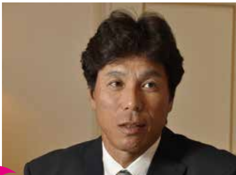
特別ゲスト 秋山幸二氏